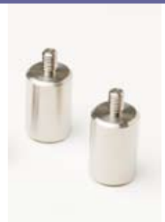
Lests de câble 605978