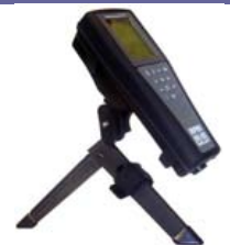
Tripode 605507, idéal pour le laboratoire