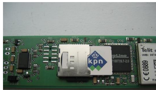
Carte SIM et carte mémoire microSD 2Go dans leurs logements superposés.

Des points de consigne peuvent être calés sur tous les paramètres mesurés. Ces points sont bas & haut (alerte) et très bas & très haut (alarme).