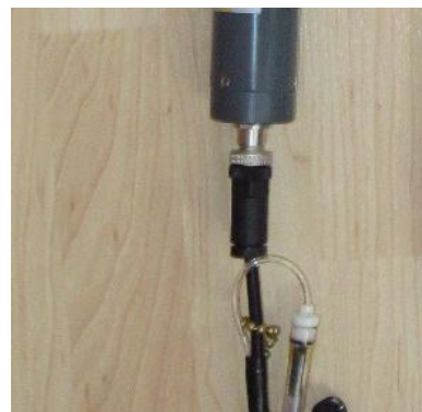
Connecteur INW sur le boîtier IP68