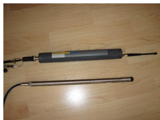
Exemple de couple centrale OMC-040-I avec une sonde numérique submersible INW CT2X (conductivité, température, salinité et niveau)