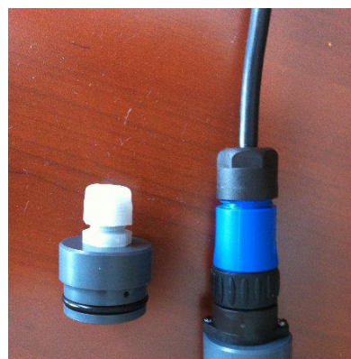
Presse étoupe Hirschmann sur le boîtier IP68