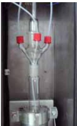
Module de digestion