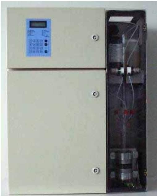
*LFA: Loop Flow Analysis patent pending

MICROMAC COD est un analyseur en ligne contrôlé par microprocesseur spécialement conçu pour la surveillance automatique de la DCO dans plusieurs types de matrice d'eau. Deux méthodes existent pour la mesure de DCO: