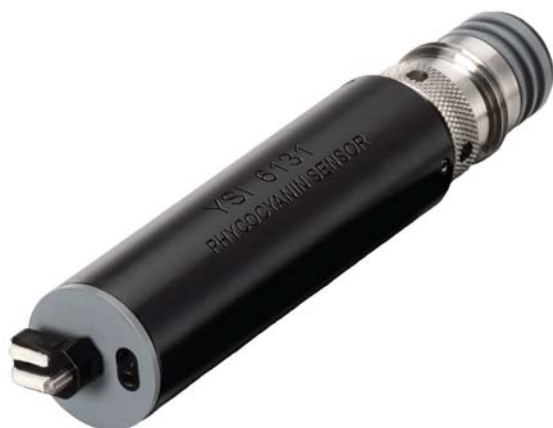
YSI 6131, capteur de cyanobactéries phycocyanine (BGA-PC)

La surveillance des algues bleu-vert (ou cyanobactéries) se développe du fait de la capacité de production par certaines espèces, de toxines et autres composés qui détériorent la qualité des eaux, mais aussi de leurs proliférations pour le moins gênantes. Les cyanobactéries sont également intéressantes dans les études et surveillances des écosystèmes où elles représentent une abondante production primaire.