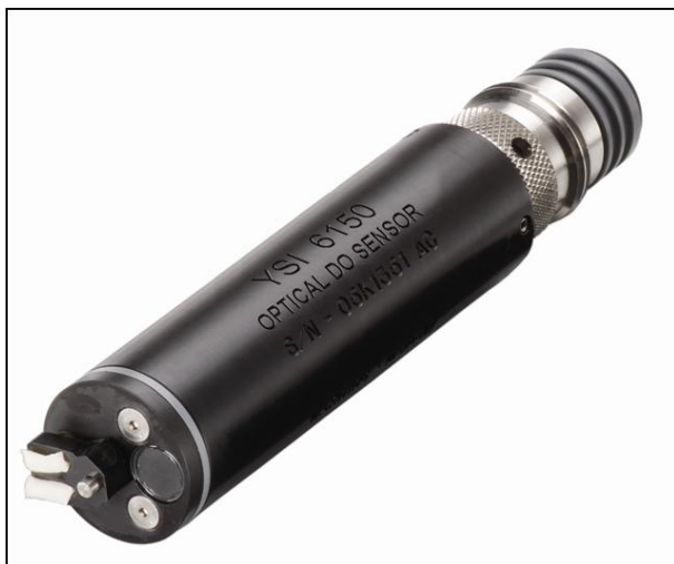
Capteur fiable d'oxygène dissous YSI 6150 ROX™

La nouvelle génération YSI ROX* est un capteur d'oxygène dissous par luminescence qui offre l'outil le plus puissant pour la prise de mesure O2d sur le long terme, dans les environnements à fort encrassement, à faible concentration O2d. Sa conception robuste et sa large gamme de mesure le rendent également adapté à l'échantillonnage ponctuel et aux mesures sur pompage via cellule passante ou directement sur les eaux souterraines.