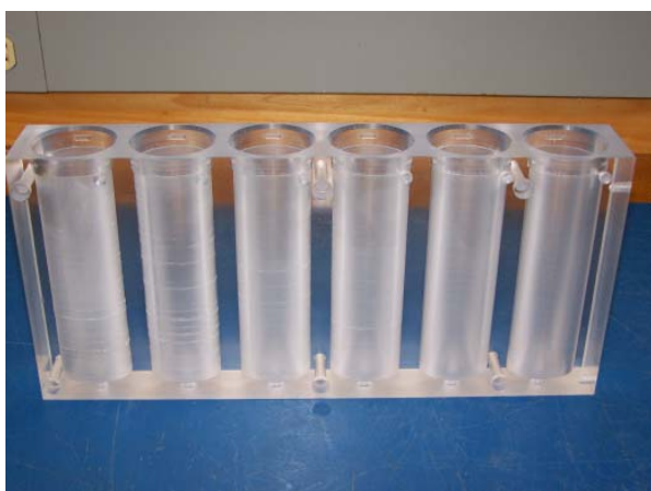
Chambres d'accueil des échantillons