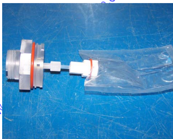
Sac réceptacle d'échantillon