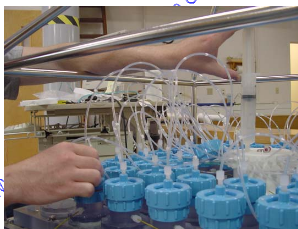
Réceptacles des échantillons