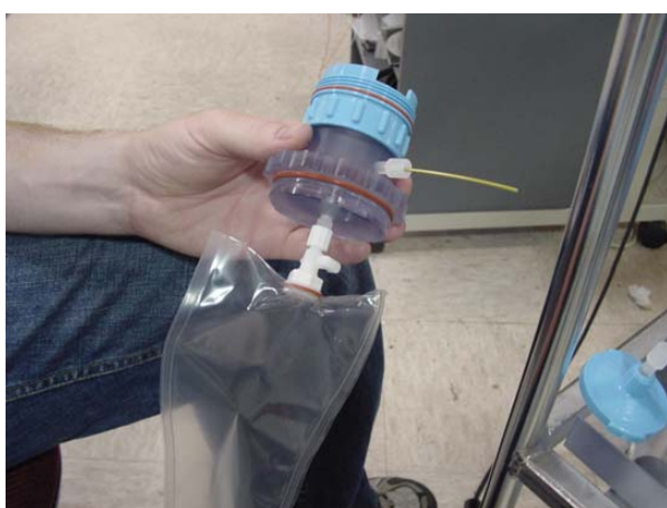
Assemblage sac et porte filtre