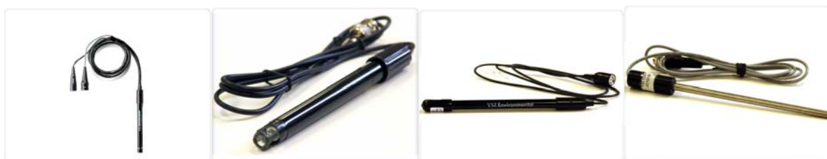
Electrodes : combinée pH-T°C - pH (bulbe, plate, perçante) – électrode redox – sonde de température