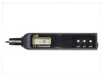
Simulateur d'électrode pH160

Connectez le simulateur d'électrode pH160 sur l'instrument pH100A et déterminez rapidement la précision de votre instrument pH100A. Le pH160 simule les valeurs pH4, pH7 et pH10.