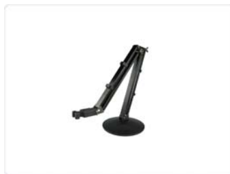
Stand pour électrode

Copyright AnHydre 09-2012 - Caractéristiques modifiables sans préavis