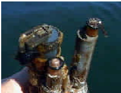
Figure 2. Un prototype 6600 EDS après 80 jours de déploiement en continu sur Buzzards Bay, MA. Le capteur à l'arrière était la mesure active d'O2d. Le capteur en haut à droite constituait la référence non balayée pour l'encrassement. Remarquez le fouling important par des espèces végétales et animales sur ce capteur non balayé.