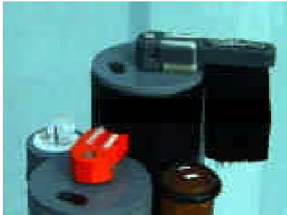
Figure 1. Profil de la nouvelle 6600 EDS montrant (sens horaire depuis la droite), les capteurs O2d Rapid Pulse™, chlorophylle, pH & redox, turbidité, tous sont protégés de l'agression encrassante du milieu par le balai universel et les raclers individuels des capteurs optiques

Autour de la précision et la fiabilité sans équivalence du capteur breveté indépendant de l'agitation , YSI Rapid Pulse™ sur l'oxygène dissous, complété par le capteur de turbidité auto nettoyant, YSI a créé la sonde YSI 6600 -EDS (Extended Deployment System).